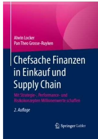
2. Auflage 2015